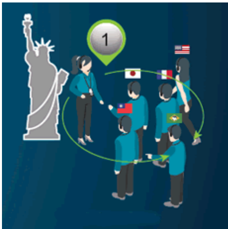
Mehrsprachige Tour (Guide startet Abspielen des gespeicherten Inhalts auf Knopfdruck)