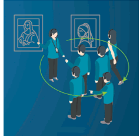
Live Tour mit Guide