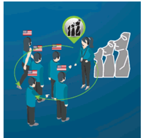
Einsprachige Tour (Guide startet Abspielen des gespeicherten Inhalts auf Knopfdruck)