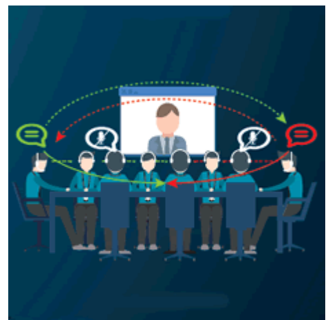
Vortrag und Diskussion mit Rücksprache der Teilnehmer